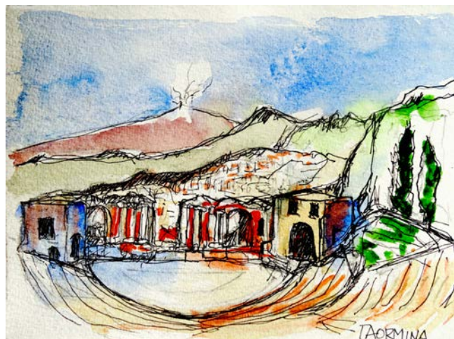
Taormina y el Etna

Damos un rodeo para acercarnos a Agrigento —que es una de las ciudades más antiguas de Sicilia—, y de ella al Valle de los Templos, en general bien conservados y que constituyen un ejemplo excepcional de la arquitectura griega antigua. Iluminados de noche, la vista del valle constituye un espectá-