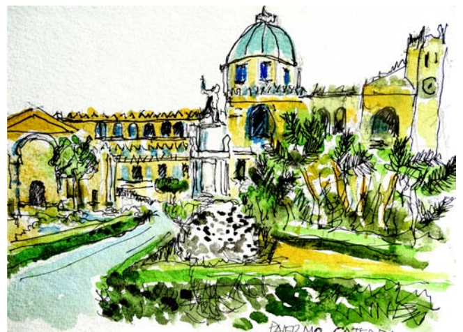
Catedral de Palermo

En Palermo encontramos un centro muy animado con la famosa plaza Vigliena —conocida como la de los ‘Quattro Canti’— sus jardines maravillosos y sus mercados al aire libre